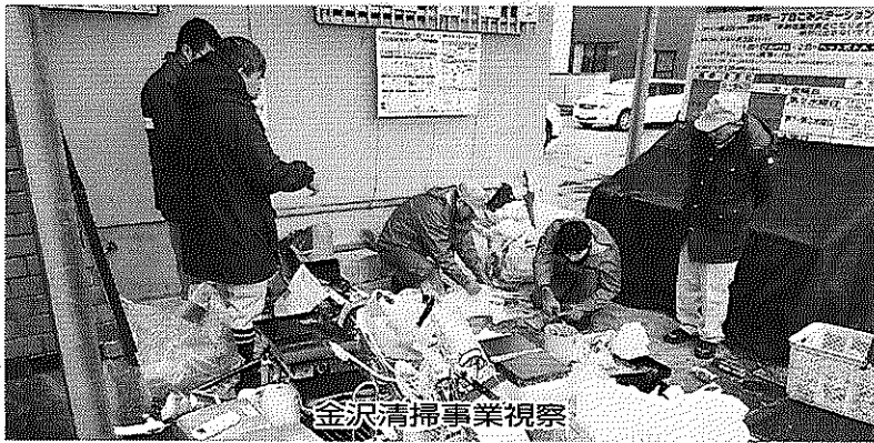
金沢清掃事業視察

練馬区の清掃リサイクル事業は、練馬清掃事務所・石神井清掃事務所・直営車両の車庫である谷原事業所をそれぞれ起点として業務をおこなっています。 この間、練馬総支部は区当局と「区民に責任ある質の高い公共サービスを提供する」という同じ考えのもとに政策協議を継続しながら、今日に至っています。 数年前に練馬区は私たちの労使協議で、これからの清掃リサイクル事業は指導・啓発業務を中心とした「管理監督型」へ移行していくという方針を出しました。これに伴い平成二十四年度から、作業係の中の「ふれあい指導班」を新たに地域係として組織再編を行いました。収集を中心として業務を担う作業係と、区民から寄せられる相談・苦情等への対応などの周知・啓発業務を担う地域係の二つの係が車の両輪のよう 直近の新規事業では、「あしすと」という施策があります。試行期間を経た上で平成二十七年から本格実施しています。分別と排出が困難で家の中に溜め込んでしまった資源やごみを、私たち直営職員が家の中に入り分別のお手伝いと収集をおこなう業務です。区民の暮らしの住環境の改善と整備のため福祉部や健康部、そして私たちが所属する環境部の連携が必要とされる流れとなっています。区の統制が図られ、横の太い構図が出来てこそ、区民の安心した生活を守ることが出来るのだと捉えています。 その他にも、地域防災計画においては、災害時に私たち直営職員が区民の安否確認と初動救命をおこなうことを清掃職員の付加価値としてつくることができました。また、同じ事業で働く練馬区まちづくり公社の資源循環推進員労組の仲間との連携、そして私たちが最も必要としている、自治研活動を通じた他自治体の清掃事業に働く仲間との繋がりが、そのどれもが私たちの生活や職場を守るため、区民が安心した生活を営むためのものです。私たちは、公務労働者として、また労働組合として日頃から自覚をもって職務を遂行していくつもりです。 最後に、今取り組んでいることをゴールにするのではなく、向上・継続させていくためにも、次世代に繋ぐバトンでもある「継続した新規採用」を勝ち取るため組合員全員の団結で取り組みます。