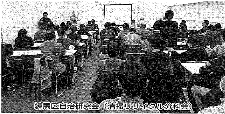
練馬区自治研究会 (清掃リサイクル分科会)