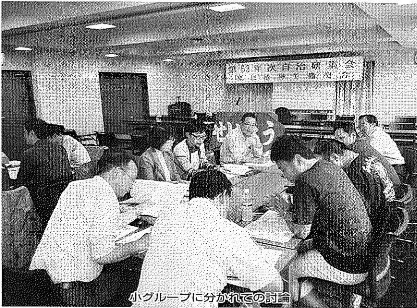
小グループに分かれての討論

5月29日・30日、箱根で開催した集会には、組合員約90人、推薦議員7名が参加し、この間に各区で実施